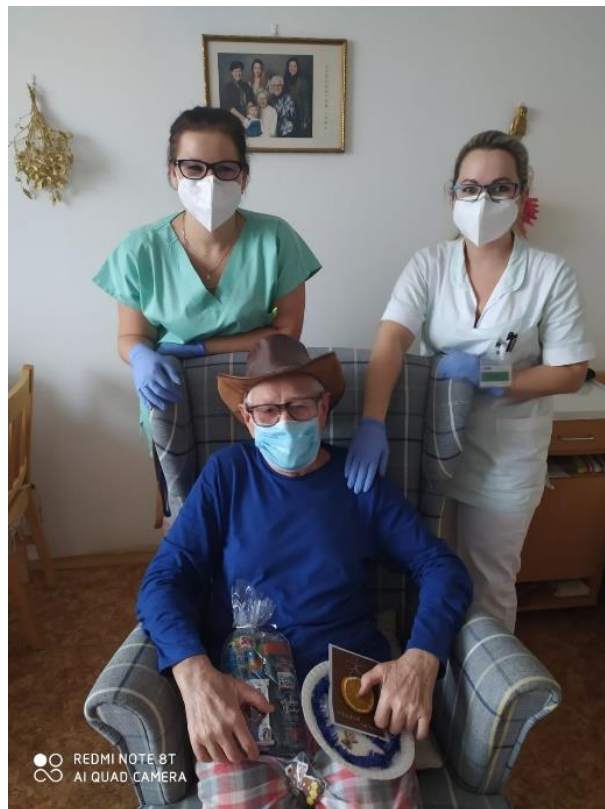
Kolektiv MSSS v Mostě – p. o.