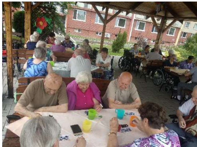
Ergoterapie – aktivizace Domov pro seniory Barvířská 495 v Mostě