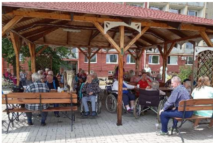
tým ergoterapie – aktivizace Domov pro seniory, ul. Barvířská 495, Most

Uživatelé se těší na další připravované akce.