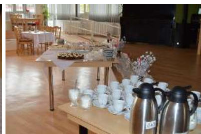
tým ergoterapie – aktivizace Domov pro seniory, ul. Barvířská 495, Most