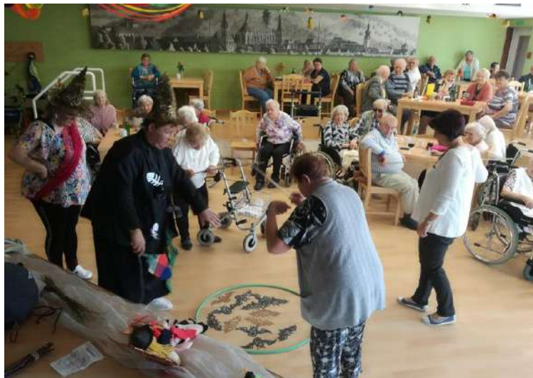
tým ergoterapie – aktivizace Domov pro seniory, ul. Barvířská 495, Most

Opět po roce se slétly v Domově pro seniory Barvířská 495 v Mostě čarodějnice, které měly pro uživatele nachystané „netopýří“ vuřty, dobrou náladu, soutěže a muziku. Zpívalo se, rejdlilo a soutěžilo. Těšíme se opět za rok v plné kráse, milé čarodějnice.