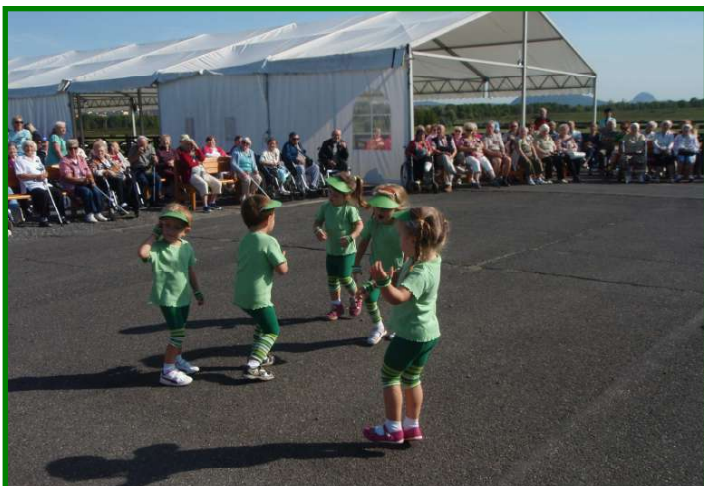
Vystoupení dětí z Denního dětského rehabilitačního stacionáře, Střediska denní péče o děti do tří let věku, ul. Františka Malíka 973 na Letním setkání seniorů dne 26. srpna 2015