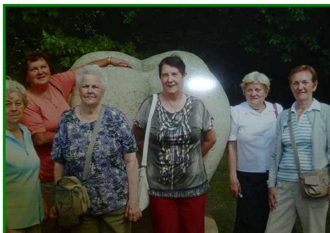
Vycházka na Benedikt, kterou pořádala samospráva Penzionu pro seniory, ul. Ke Koupališti 1180 dne 15. července 2015