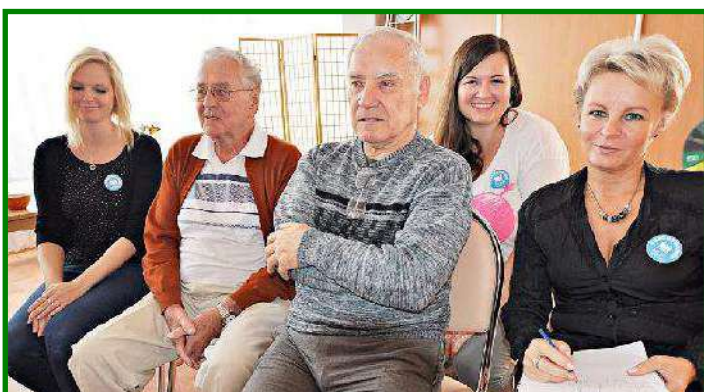
Dobrovolnický den v Domově pro seniory, ul. Barvířská 495 dne 18. září 2015

vydává Městská správa sociálních služeb v Mostě – příspěvková organizace