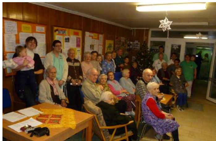
Akce „Česko zpívá koledy“ v Domově pro seniory, ul. Jiřího Wolкера 404 dne 11. prosince 2013