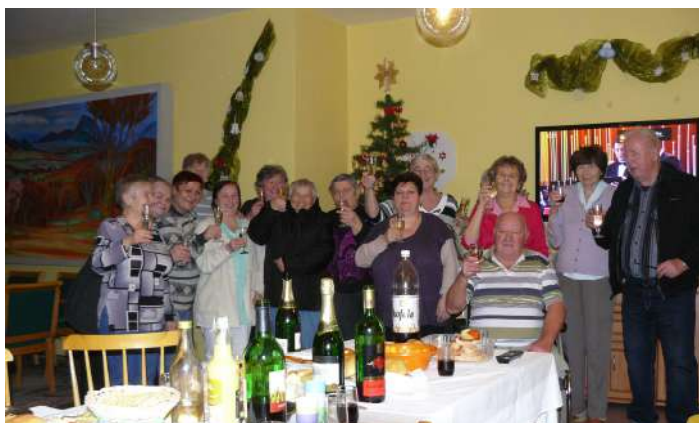
Silvestr v Penzionu pro seniory, ul. Albrechtická 1074 dne 31. prosince 2013

vydává Městská správa sociálních služeb v Mostě – příspěvková organizace