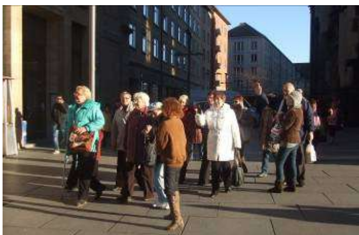
Senioři z Domů s pečovatelskou službou v Mostě v Drážďanech dne 12. prosince 2013