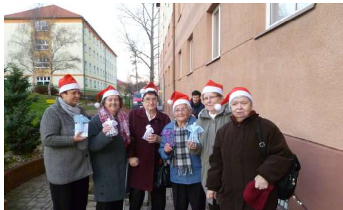
Komořanky vystoupily v Domově pro seniory, ul. Antonína Dvořáka 2166 dne 2. prosince 2013