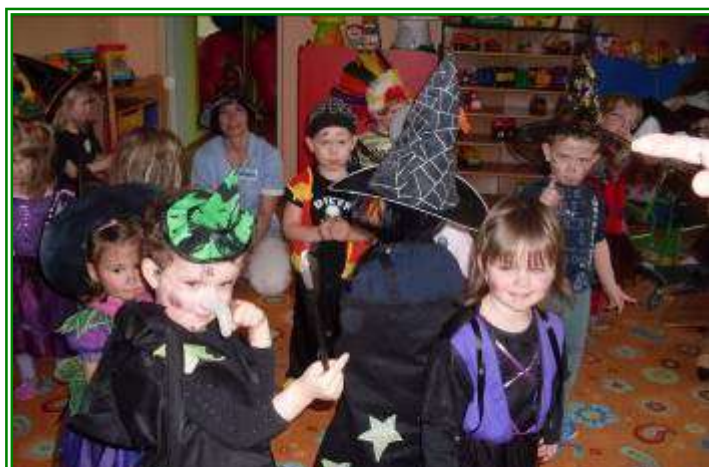
Rej čarodějnic v Denním dětském rehabilitačním stacionáři, Středisku denní péče o děti do tří let věku, ul. Františka Malíka 973 dne 30. dubna 2013