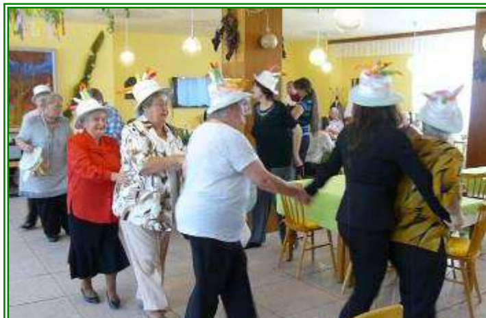
Májová zábava v Penzionu pro seniory, ul. Albrechtická 1074 dne 30. května 2013