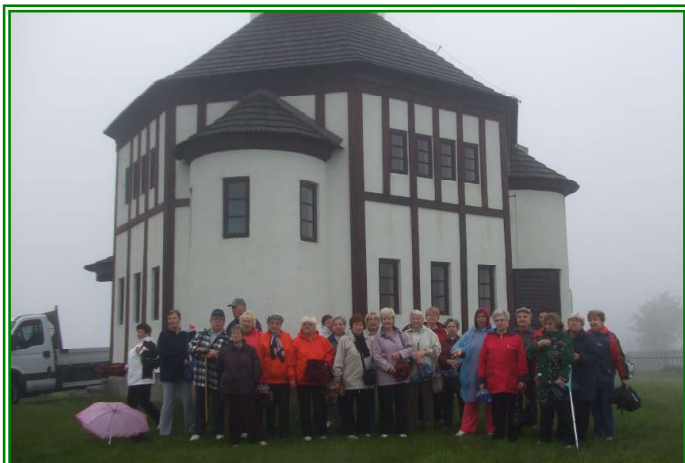
Rekreace seniorů v Kořenově ve dnech od 25. května do 1. června 2013

vydává Městská správa sociálních služeb v Mostě – příspěvková organizace