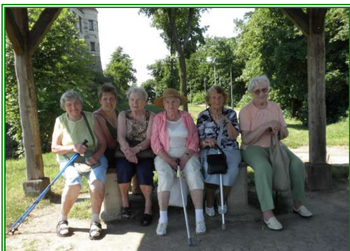
Výlet uživatel Domova pro seniory, ul. Barvířská na hradě Hněvín