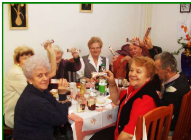
Vítání Nového roku 2013 v Domě s pečovatelskou službou, ul. Růžová bl. 566 dne 3. ledna 2013