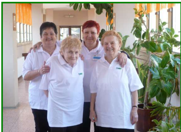
Seniorky společně s kulturně výchovnou pracovnící na 3. turnaji ve cvrkané v Libochovicích dne 20. března 2013