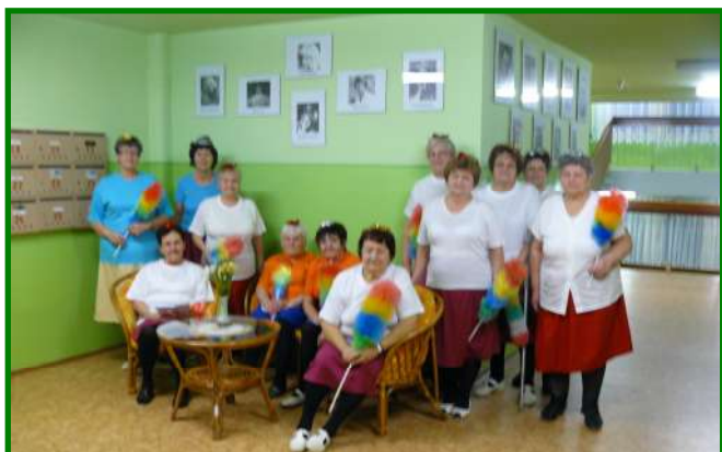
Maškarní zábava v Penzionu pro seniory, ul. Albrechtická 1074 dne 22. února 2013

vydává Městská správa sociálních služeb v Mostě – příspěvková organizace