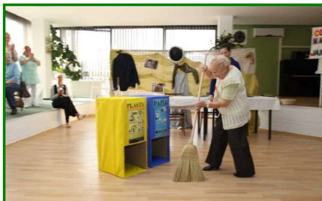
Soutěžní odpoledne „Co se v mládí naučíš, ve stáří jako když najdeš“ konané v Domově pro seniory, ul. Barviřská 495 dne 20. března 2013