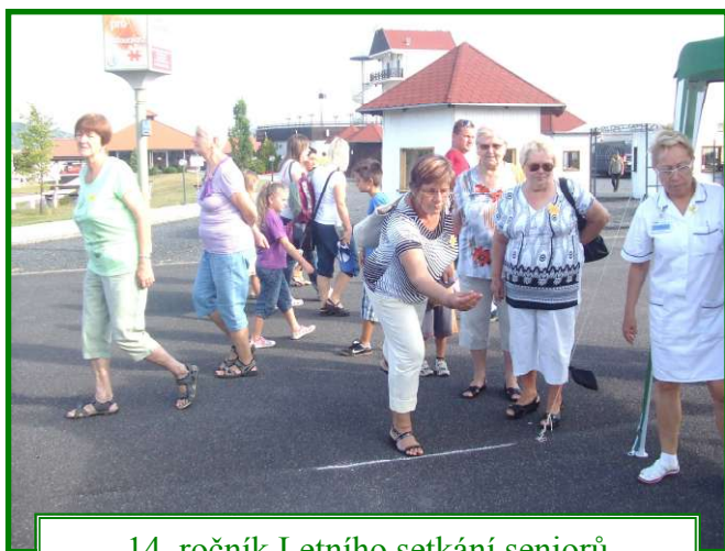
14. ročník Letního setkání seniorů konaný dne 29. srpna 2012 na mosteckém hipodromu