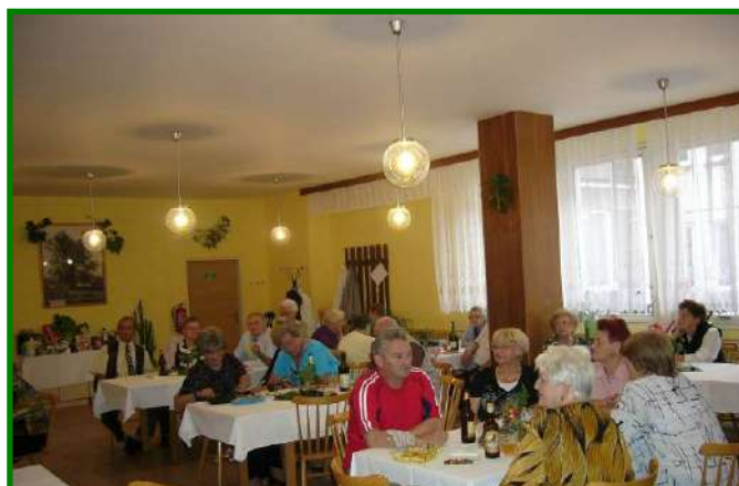
Václavská zábava konaná dne 26. září 2012 v Penzionu pro seniory, ul. Albrechtická 1074