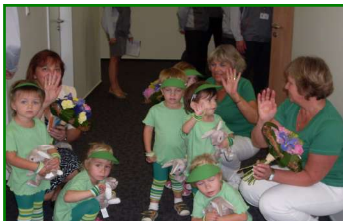
Děti ze Střediska denní péče pro děti do tří let věku, ul. Františka Malíka 973 po vystoupení ve firmě Hitachi Automotive Systems Czech, s. r. o. dne 11. září 2012