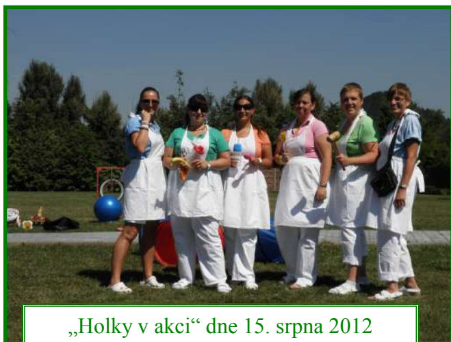
„Holky v akci“ dne 15. srpna 2012 v Domově pro seniory, ul. Barvířská 495

vydává Městská správa sociálních služeb v Mostě – příspěvková organizace