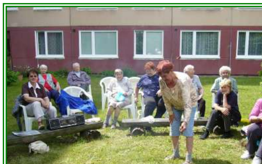
Táborák v Penzionu pro seniory v ul. Ke Koupališti 1180 dne 12. června 2012