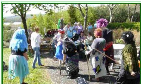
Noc čarodějnic v Penzionu pro seniory v ul. Albrechtická 1074 dne 24. dubna 2012

vydává Městská správa sociálních služeb v Mostě – příspěvková organizace