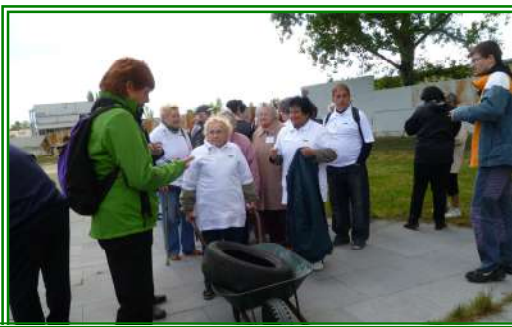
Sportovní hry seniorů Ústeckého kraje v Litvínově dne 17. května 2012