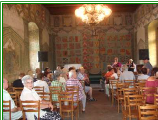
Obyvatelé Domu s pečovatelskou službou v ul. U Parku bl. 566 na výletě v Budyni nad Ohří dne 21. června 2012