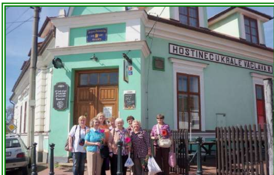
Komořanky na Točniku dne 26. dubna 2012