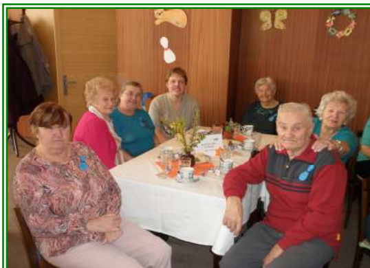
Uživatelé Domova pro seniory v ul. Barvířská 495 na Turnaji v kuželkách v Penzionu pro seniory v ul. Ke Koupališti 1180 dne 17. dubna 2012