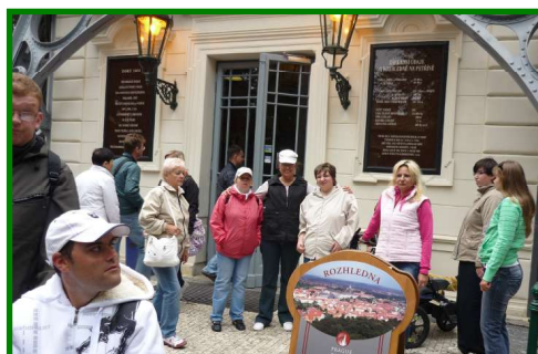
Výlet na Petřínské rozhledně v Praze dne 8. září 2011