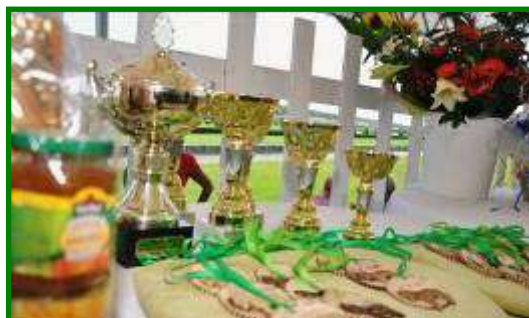
13. Letní setkání seniorů na mosteckém hipodromu dne 24. srpna 2011