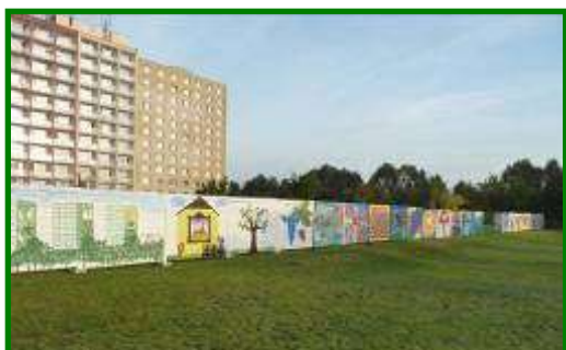
Nový plot Domova pro seniory v ul. Barviřská 495 malovaný ve dnech 12. – 16. září 2011