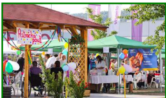
Slunce, seno, prázdniny aneb Astrácká pouť dne 31. srpna 2011