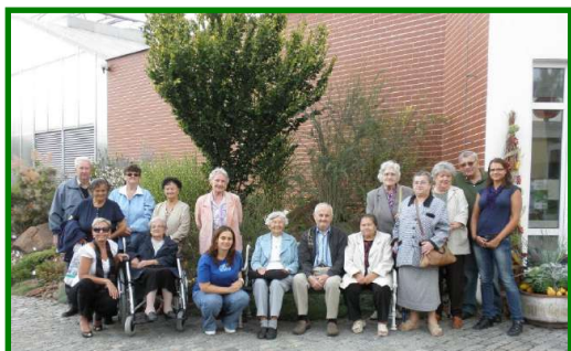
Výlet seniorů Domova pro seniory v ul. Barviřská 495 v Botanické zahradě v Teplicích dne 23. září 2011