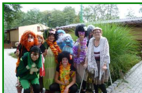
Rekondiční pobyt v Sázavském ostrově ve dnech od 4. do 10. září 2011