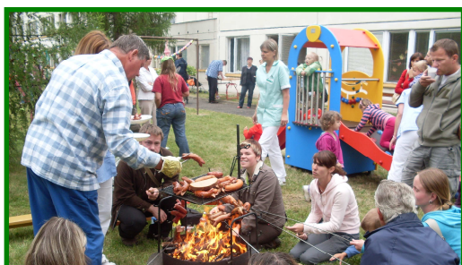
Den dětí v Denním dětském rehabilitačním stacionáři, Středisku denní péče v ul. Františka Malíka 973