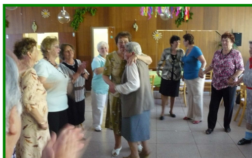
Májová veselice v Penzionu pro seniory v ul. Albrechtická 1074