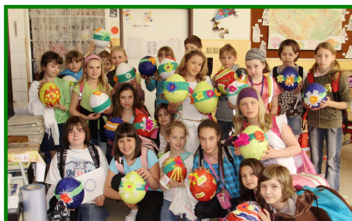
Velikonoce v Domově pro seniory v ul. Barvířská 495