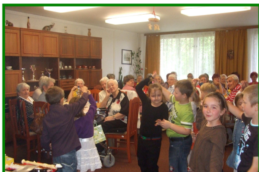
Den matek v Domě s pečovatelskou službou v ul. Růžová 2071