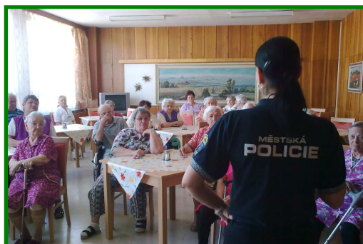
Beseda s Městskou policií v Domově pro seniory v ul. Jiřího Wolкера 404