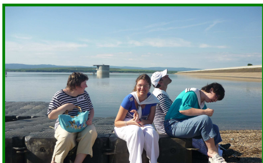
Naši námořníci na pláži Nechanické přehrady