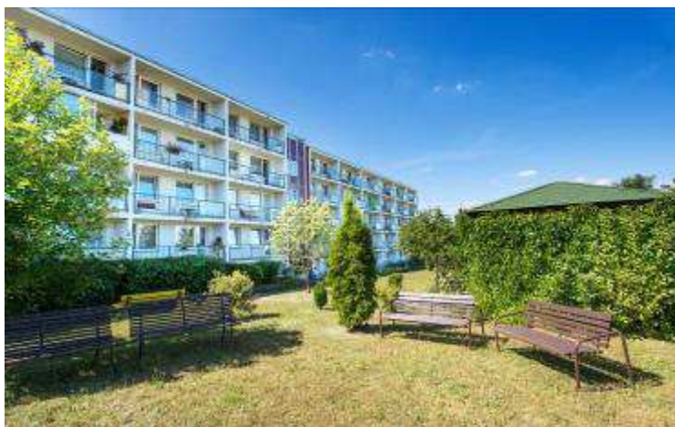
Obrázek č. 11 Objekt Komořanská 818, Most