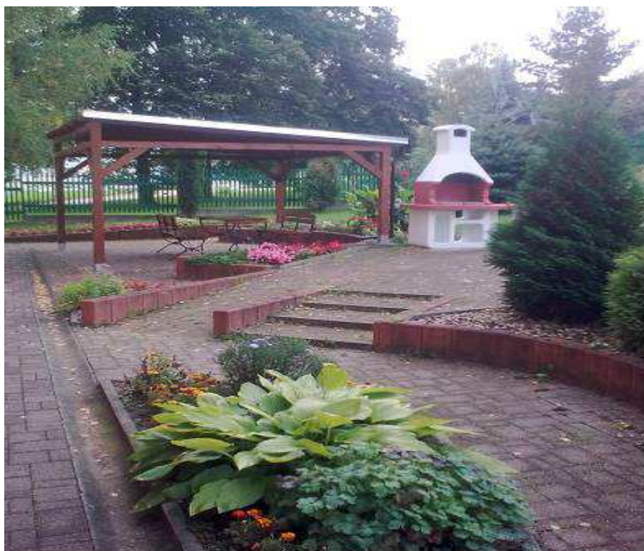
Obrázek č. 8 Objekt Antonína Dvořáka 2166, Most (pergola)

V roce 2014 byla v prostorách zahrady objektu vybudována pergola.