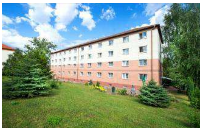
Obrázek č. 7 Objekt Antonína Dvořáka 2166, Most