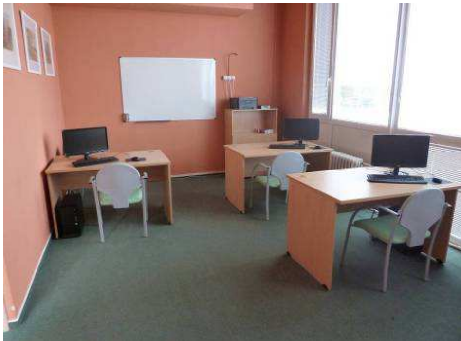
Obrázek č. 3 Objekt Barviřská 495, Most - počítačová učebna

V roce 2014 byly provedeny tyto významnější rekonstrukce a opravy objektu domova pro seniory: