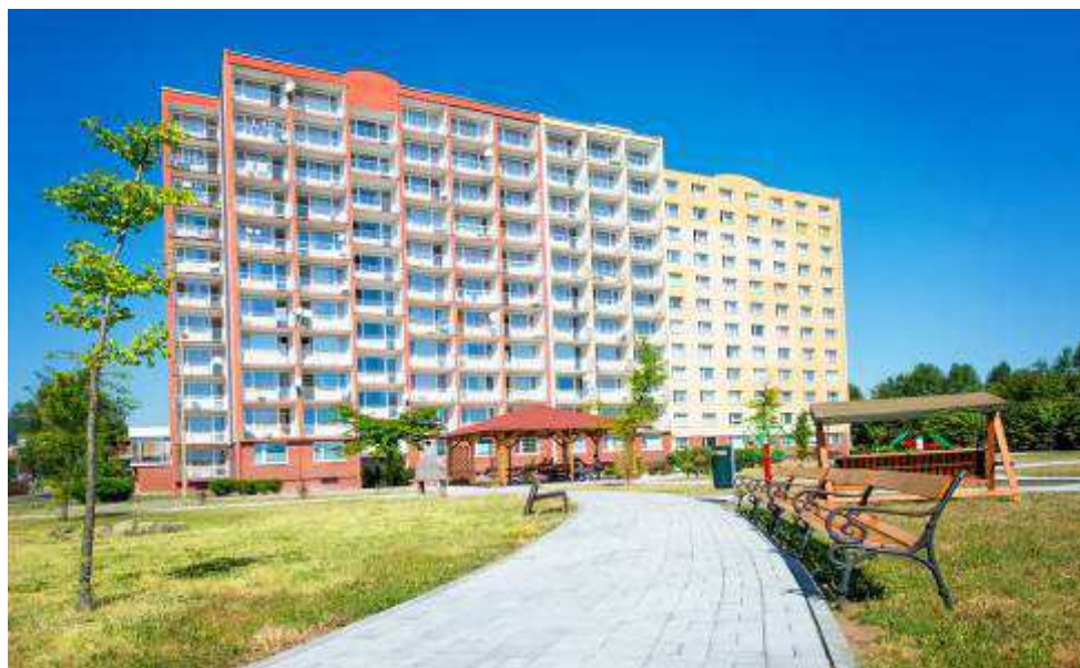
Obrázek č. 2 Objekt Barviřská 495, Most

Uživatelé domova pro seniory mají k dispozici 29 jednolůžkových pokojů s vlastním sociálním zařízením (tzv. garsonky), 114 bytů typu 1 + 1 (dva samostatné jednolůžkové pokoje se společným sociálním zařízením) a 2 byty typu 1 + 1 pro čtyři obyvatele se společným sociálním zařízením. Pokoje jsou standardně vybaveny. Každoročně se část pokojů vybavuje elektrickými polohovacími pečovatelskými lůžky (v roce 2014 bylo zakoupeno devět takových lůžek). V objektu domova pro seniory je k dispozici ordinace lékaře, centrální společenská místnost a jídelna (jídelny a společenské místnosti jsou i na každém patře objektu), místnost pro rehabilitaci a ergoterapii nebo počítačová učebna. V té se obyvatelé učí základní úkony na počítači, zakládat e-mailové schránky, ale také například propojit fotoaparát s počítačem, vypalovat CD, vyhledávat na internetu apod.