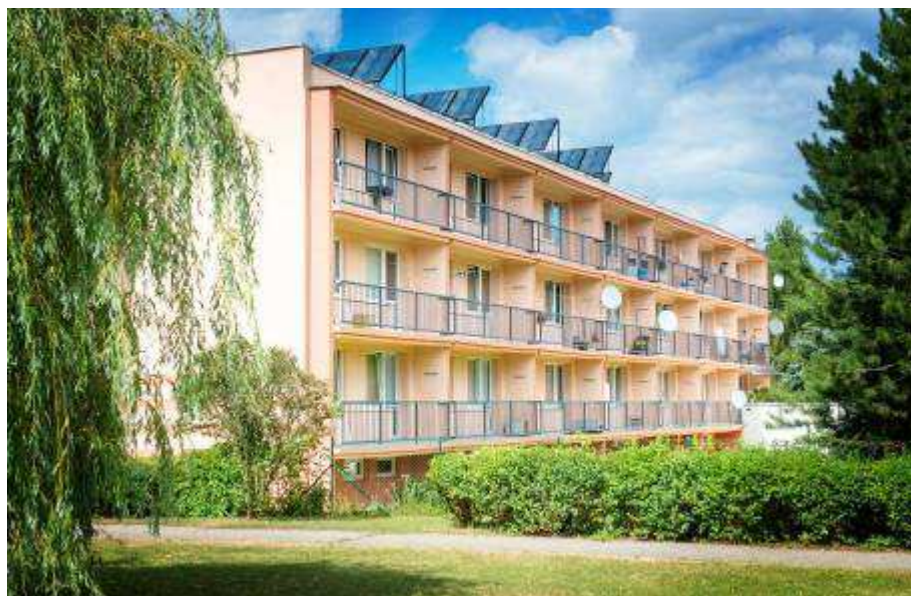
Obrázek č. 6 Objekt Jiřího Wolkeru 404, Most

Objekt domova pro seniory se skládá ze tří spolu propojených budov, objekt je po částečné rekonstrukci a od roku 2012 využívá pro ohřev teplé vody 56 solárních panelů nainstalovaných na střeše objektu.