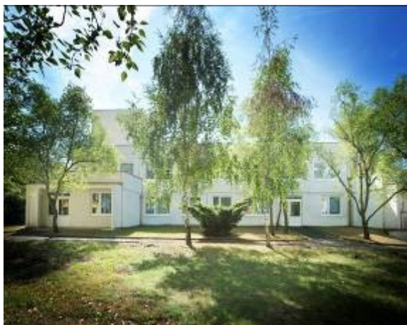
Tabulka č. 11 Denní dětský rehabilitační stacionář - přehled léčebných výkonů za rok 2013

vývoj dítěte, včetně psychologického a výchovného vedení i sociální adaptace. Kapacita služby je 20 klientů. V roce 2013 využívalo služeb stacionáře 22 klientů, průměrný věk – 6 let.