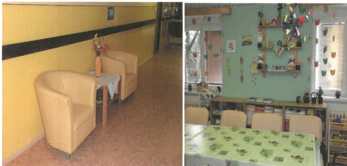
Obrázek č. 9 Objekt Antonína Dvořáka 2166, Most – společné prostory zařízení

V roce 2017 byla zrealizována řada akcí za účelem zkvalitnění služby pro uživatele: