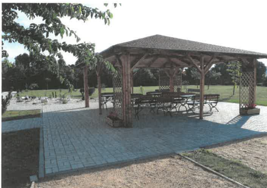
Obrázek č. 4 Objekt Barviřská 495, Most – altán na zahradě

Do centrální kuchyně byla pořízena klimatizační jednotka. Prostory pro uživatele byly vybaveny elektrickými transportními zvedáky, toaletními křesly, elektrickými polohovacími pečovatelskými lůžky.