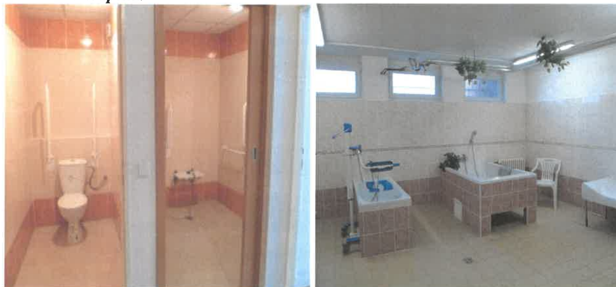
Obrázek č. 6 Objekt Jiřího Wolкера 404, Most – zrekonstruovaná sociální zařízení a centrální koupelna

Kapacita služby je 97 lůžek. Služba je poskytována nepřetržitě. Ubytování je poskytováno ve dvou třípodlažních budovách umístěných v prostředí, které uživatelům umožňuje sociální kontakt s okolním prostředím. Uživatelé mají k dispozici 25 jednolůžkových pokojů s vlastním sociálním zařízením (tzv. garsonky) a 36 bytů typu 1 + 1 (dva samostatné jednolůžkové pokoje se společným sociálním zařízením), které jsou vybaveny vlastním nábytkem uživatele. Společné prostory jsou k dispozici všem uživatelům i špatně mobilním či pohybujícím se na vozíku. Pohyb mezi patry a ven je umožněn bezbariérovým výtahem. Uživatelé mohou využívat klubovnu s televizí, chodby, ergoterapeutickou dílnu, společnou jídelnu a zahradu. Chodby na jednotlivých patrech jsou vybaveny dřevěnými madly usnadňujícími pohyb a nejsou na nich zbytečné překážky. Uživatelům umožňují posezení křesla umístěná na společných chodbách. Výzdoba společných prostor je z části dílem některých uživatelů. Ti mohou své tvůrčí schopnosti projevit v ergoterapeutické dílně při aktivizačních činnostech pod vedením ergoterapeutky. Uživatelé se mohou stravovat na hlavní jídelně v budově domova či na bytových jednotkách. Uživatelům, s nutností vhodné diety, jsou zajištěna dieta diabetická, žlučnicková, či neslaná. Uživatelům je zajišťována péče v rozsahu základních činností. Uživatelům mohou být poskytovány poskytovatelem fakultativní činnosti poskytované nad rámec základních činností.