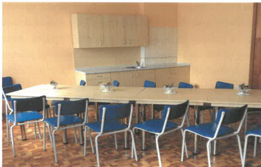
Obrázek č. 7 Objekt Jiřího Wolkerova 404, Most – jídelnička

V roce 2017 byla v objektu provedena celková oprava vestibulu přízemí objektu a kompletní oprava zvonků. Byly opraveny prostory pro ergoterapii včetně vybavení novým nábytkem. Byly zakoupeny manipulační a úklidové vozíky. Do několika bytových jednotek byla pořízena nová elektrická polohovací pečovatelská lůžka.