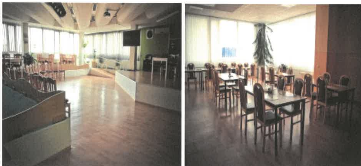
Obrázek č. 3 Objekt Barviřská 495, Most – společenský sál a jídelna

V roce 2017 bylo průběžně prováděno malování bytových jednotek a centrální kuchyně, výměna podlahové krytiny v bytových jednotkách, výměna patientských souprav sestra – pacient.