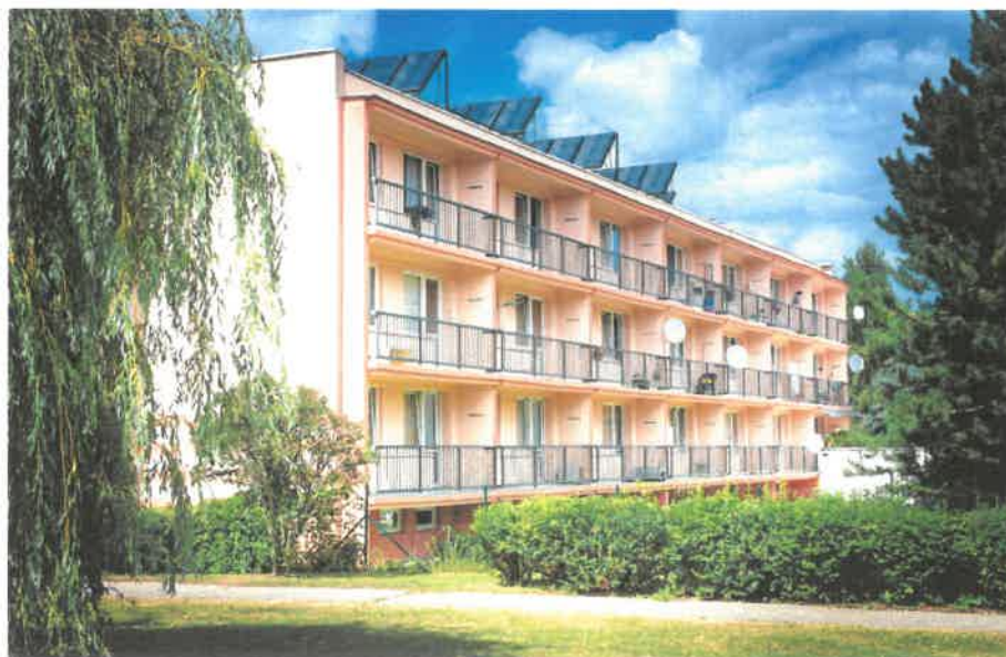
Obrázek č. 5 Objekt Jiřího Wolкера 404, Most

Objekt domova pro seniory se skládá ze tří spolu propojených budov, objekt je po částečné rekonstrukci a od roku 2012 využívá pro ohřev teplé vody 56 solárních panelů nainstalovaných na střeše objektu.