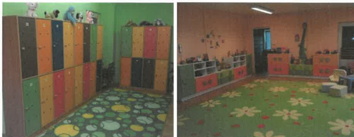
Obrázek č. 16 Středisko denní péče – prostory příjmu a herny

Děti docházející do střediska (společně s dětmi z denního dětského rehabilitačního stacionáře) se zúčastnily mnoha akcí, např.: