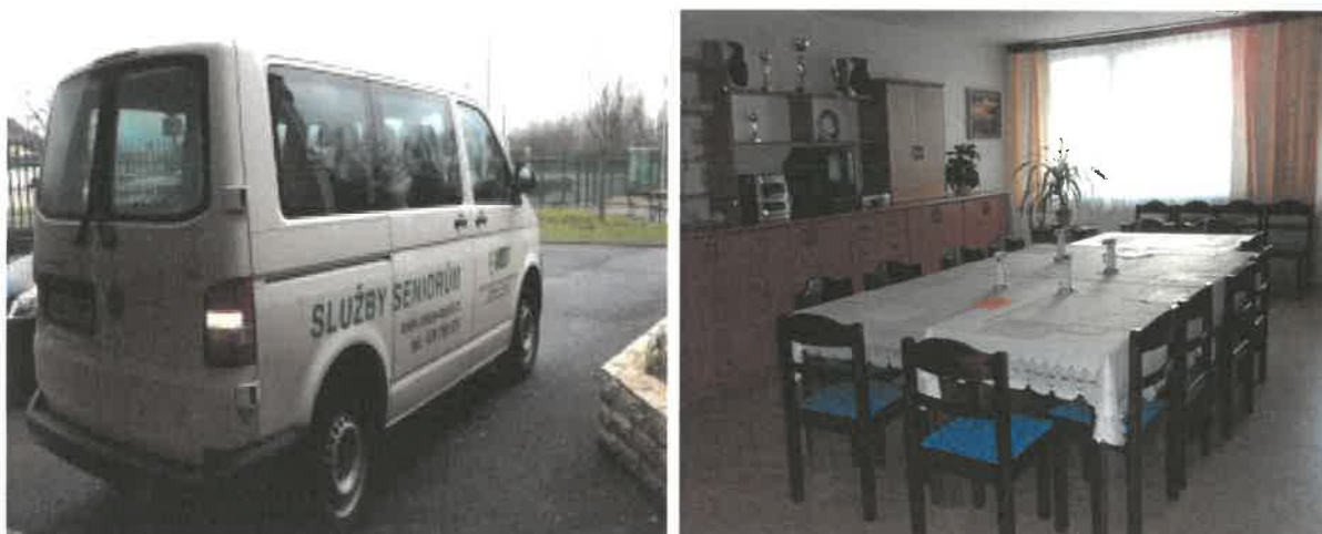
Obrázek č. 15 Pečovatelská služba – vozidlo pro rozvoz stravy a kulturní místnost v domě s pečovatelskou službou