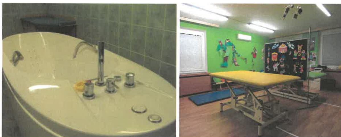
Obrázek č. 14 Objekt Františka Malíka 973, Most – prostory rehabilitace

Aktivizace se neomezuje jen na spolupráci při rehabilitaci, současně je nutné podporovat neuropsychický vývoj dítěte, včetně psychologického a výchovného vedení i sociální adaptace. Současně s léčenou je dětem poskytována také výchovně - vzdělávací a sociální péče. Tuto péči zajišťují speciální pedagog a pracovnice v sociálních službách. V roce 2017 bylo pořízeno nové vybavení rehabilitace - model k nácviku procedur a pomůcky k individuálnímu cvičení.