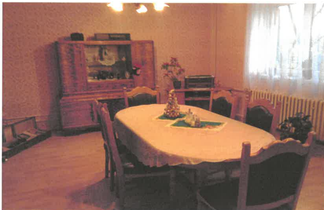
Obrázek č. 10 Objekt Antonína Dvořáka 2166, Most - reminiscenční místnost