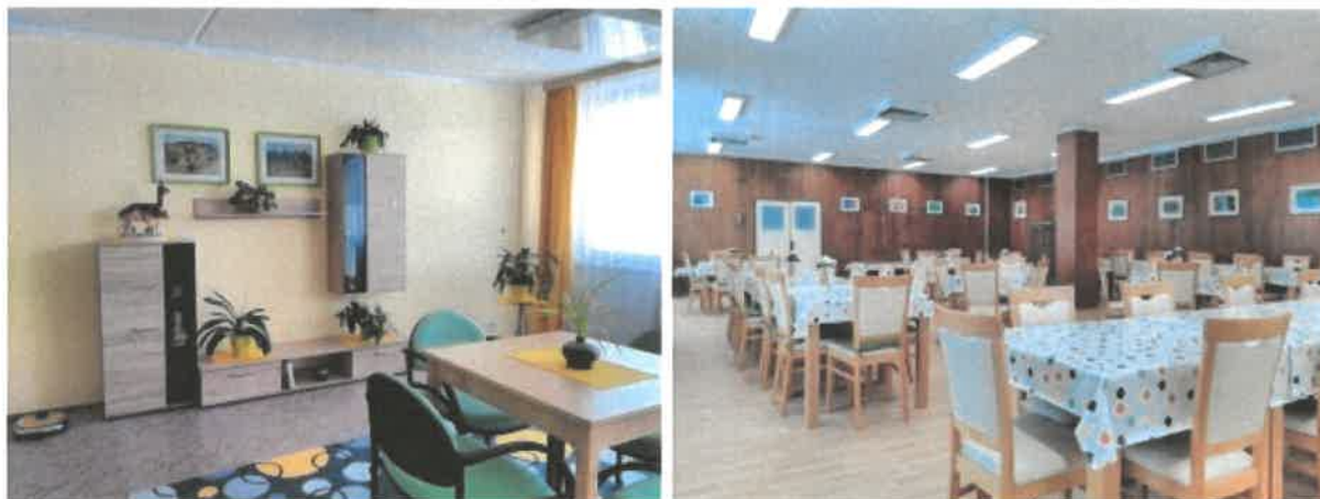
Obrázek č. 18 Objekt Komořanská 818, Most – společné prostory

V roce 2017 byl proveden nátěr všech zárubní a radiátorů v budově C a nátěr radiátorů v kancelářích penzionu, dále proběhla montáž nové kuchyňské linky a pultu v kuchyni u jídelny, instalace nových zvonků v celém objektu, balkóny v klubovnách opatřeny sítěmi proti holubům a pokládka lina na chodbách před byty obyvatelů a u výtahu. Byla pořízena nová velká sedací souprava do jídelny. V zařízení působí soubor Komořanky.