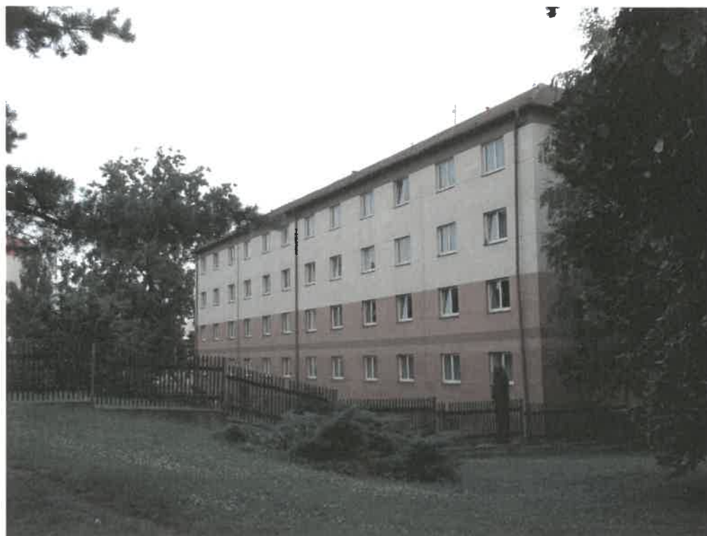
Obrázek č. 8 Objekt Antonína Dvořáka 2166, Most