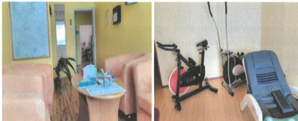
Obrázek č. 20 Prostory Poradny pro rodinu, manželství a mezilidské vztahy

kalendářních měsíců. Celkem poradna zrealizovala 24 vzdělávacích seminářů. Za tímto účelem bylo instalováno nové promítací plátno a pořízen dataprojektor.