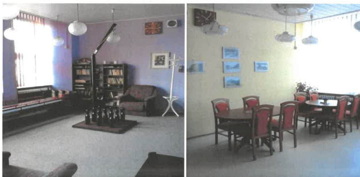
Obrázek č. 19 Objekt Ke Koupališti 1180, Most – společné prostory