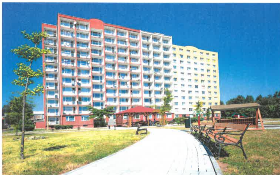
Obrázek č. 2 Objekt Barviřská 495, Most

Kapacita služby je 273 lůžek. Služba je poskytována nepřetržitě. Ubytování je poskytováno ve dvanáctipodlažní budově umístěné v prostředí, které uživatelům umožňuje sociální kontakt s okolním prostředím. Ubytování je zajištěno z větší části v jednolůžkových pokojích. Bytová jednotka se skládá ze dvou pokojů a má pro oba pokoje společné sociální zařízení. Výjimkou jsou garsoniéry, které mají sociální zařízení zcela samostatné. V zařízení jsou též dvoulůžkové pokoje, které jsou určeny imobilním uživatelům, kteří potřebují maximální podporu při péči o vlastní osobu. Kromě koupelen na jednotlivých bytech je k dispozici uživatelům pět vybavených centrálních koupelen. Všechny bytové jednotky jsou vybaveny signalizačním zařízením. Pokud uživatel potřebuje z důvodu své špatné mobility signalizaci u lůžka, je mu přidělen pager. Uživatelé se mohou stravovat na hlavní jídelně v budově domova, nebo dle zdravotního stavu na kuchyňkách v příslušném patře, či na bytových jednotkách. Uživatelům, s nutností vhodné diety, jsou zajištěna dieta diabetická, žlučnicková, či neslaná. Uživatelům je zajišťována péče v rozsahu základních činností. Uživatelům mohou být poskytovány poskytovatelem fakultativní činnosti poskytované nad rámec základních činností.