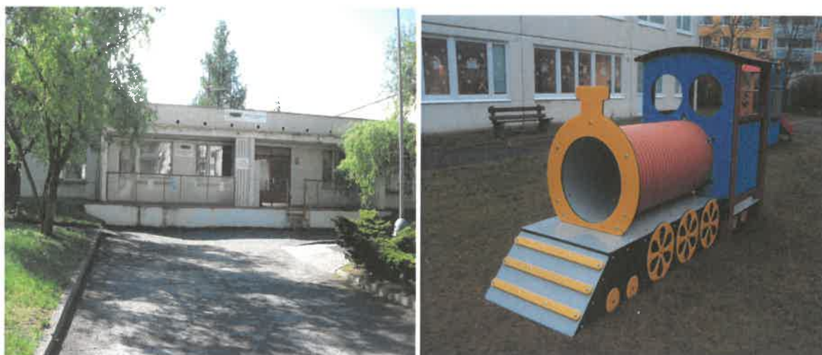
Obrázek č. 13 Objekt Františka Malíka 973, Most

Prostory stacionáře byly vybaveny novou lavicí, sedací soupravou a lednicí.