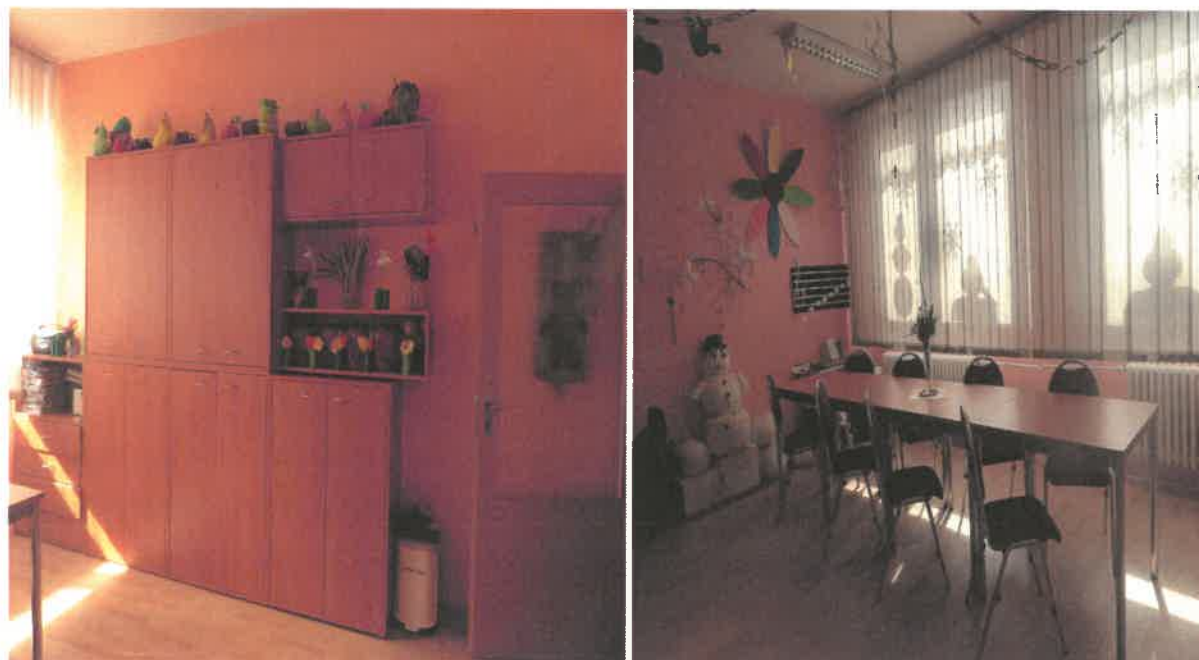
Obrázek č. 11 Objekt Jiřího Wolkerova 404, Most – prostory stacionáře

Služba byla v roce 2017 poskytnuta 14 klientům. Pro zlepšení prostředí stacionáře byl v roce 2017 zakoupen nový nábytek do kanceláře pracovníků v sociálních službách. Pro uživatele byla zorganizována spousta aktivit, které vedly k integraci osob s mentálním postižením do společnosti.