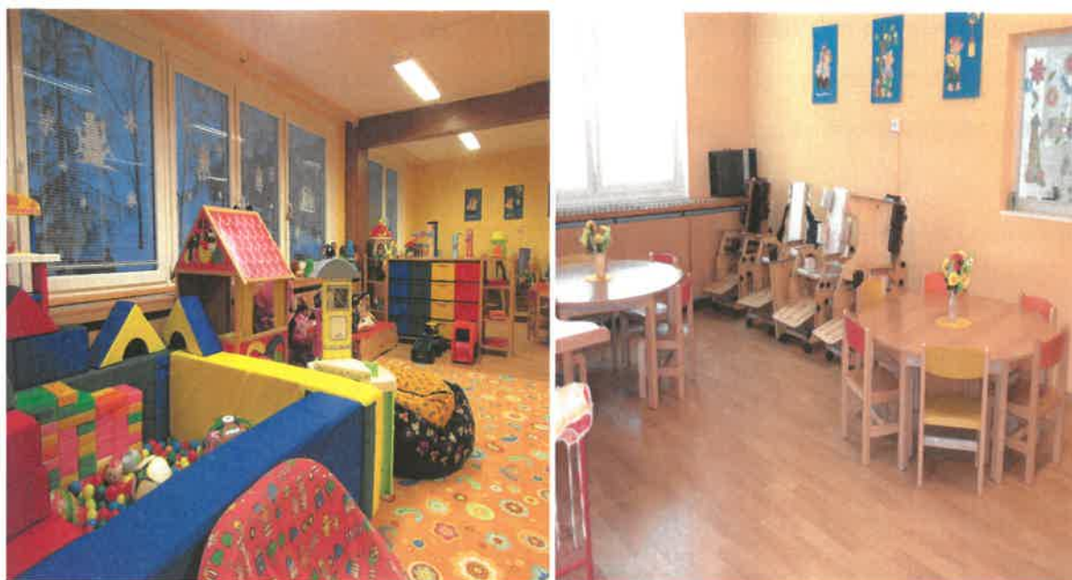
Obrázek č. 12 Objekt Františka Malíka 973, Most – prostory stacionáře

V roce 2017 byla provedena výměna kuchyňské linky, byly vymalovány prostory kuchyně. Prostor kuchyně a stacionáře byl vybaven klimatizační jednotkou. Do kuchyně byla zakoupena lednice a elektrický mlýnek na maso. Byly provedeny stavební úpravy kanceláře sociální pracovníce tak, aby prostory byly přiměřené druhu poskytované sociální služby, její kapacitě, počtu uživatelů a individuálním potřebám osob, kterým je služba poskytována. Před objektem bylo vybudováno menší parkoviště.