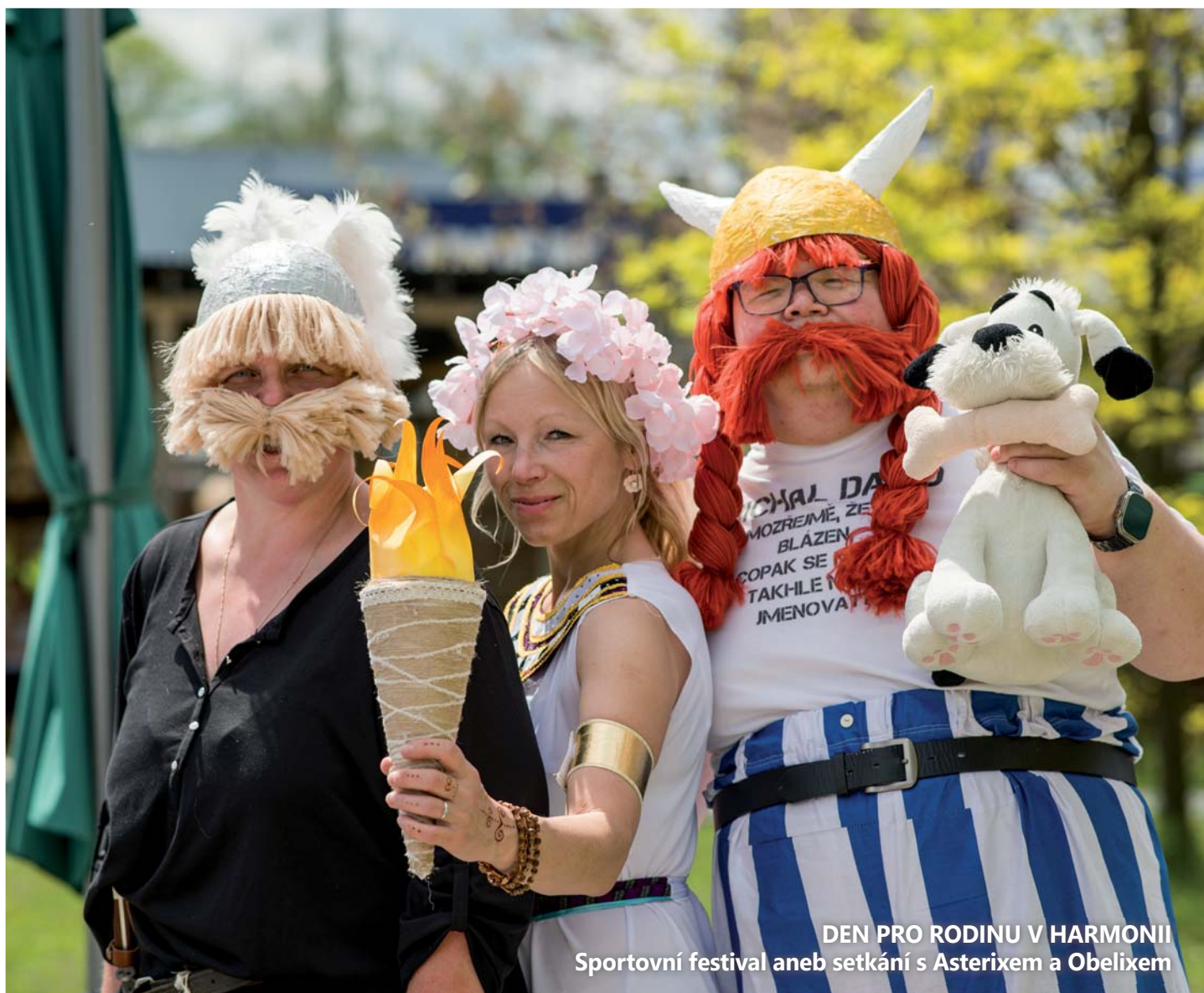
DEN PRO RODINU V HARMONII Sportovní festival aneb setkání s Asterixem a Obelixem